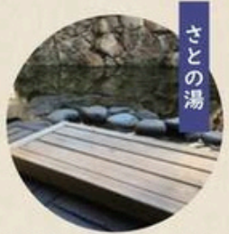
Satono-yu foot bath The bench is floor-height. Please take care when lowering yourself down on the bench.