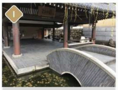
1 Satono-yu foot bath 7:00~21:00 (Mondays until 18:00) The closest footbath from the station