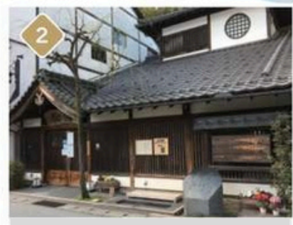
2 Yanagi-yu foot bath 15:00~23:00 (closed Thursdays)