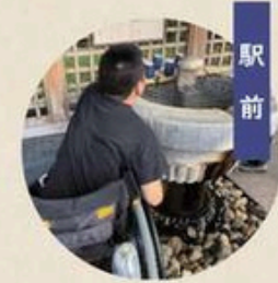
Station hand bath