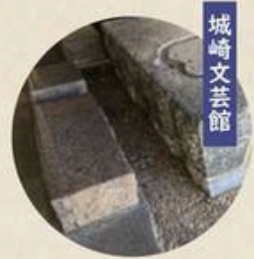
Literature Museum foot and hand bath The benches are higher than most foot baths'.