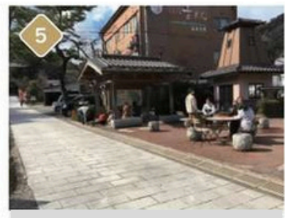
5 Moto-yu footbath 24 hours