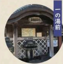
Ichino-yu hand bath