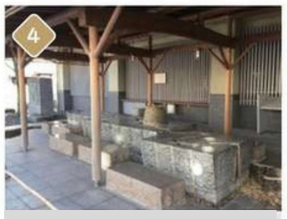
4 Literature Museum foot and hand bath 9:00~16:30 (weekends and holidays only)