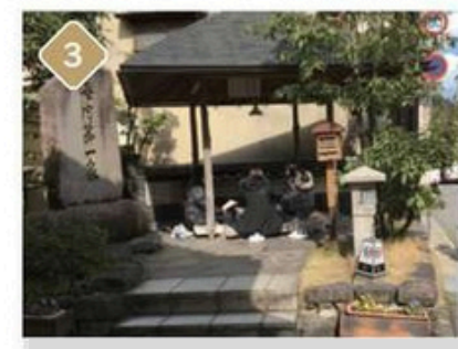
3 Ichino-yu foot bath 7:00~22:30 There are stairs up to the bath